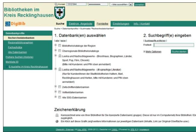
Suchmaske (Bibliotheksverbund Kreis Recklinghausen)

Sie suchen Literatur für Schule, Studium und Beruf? Sie wollen sich aber weder durch den Dschungel der Treffer von Google kämpfen noch in zahlreichen Datenbanken immer erneut die gleiche Anfrage stellen? Dann ist die Digitale Bibliothek (DigiBib) mit ihrer gleichzeitigen Suche in unterschiedlichen Quellen Ihr Weg zur relevanten Literatur.